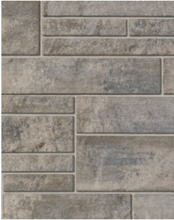
ASHLAND Emballage Multi †