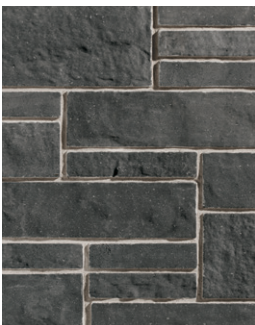
MINUIT Emballage Multi †