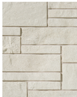
BLANC POLAIRE ✦ Emballage Multi †