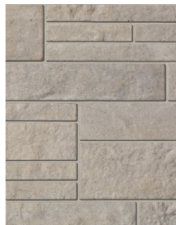
SOLEIL LEVANT Emballage Multi †