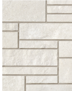
BLANC D'ISLANDE ✦ Emballage Multi