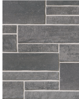
CENDRÉ Emballage Multi †