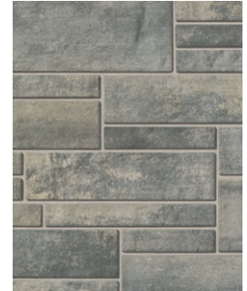
GRIS MARBRÉ Emballage Multi †