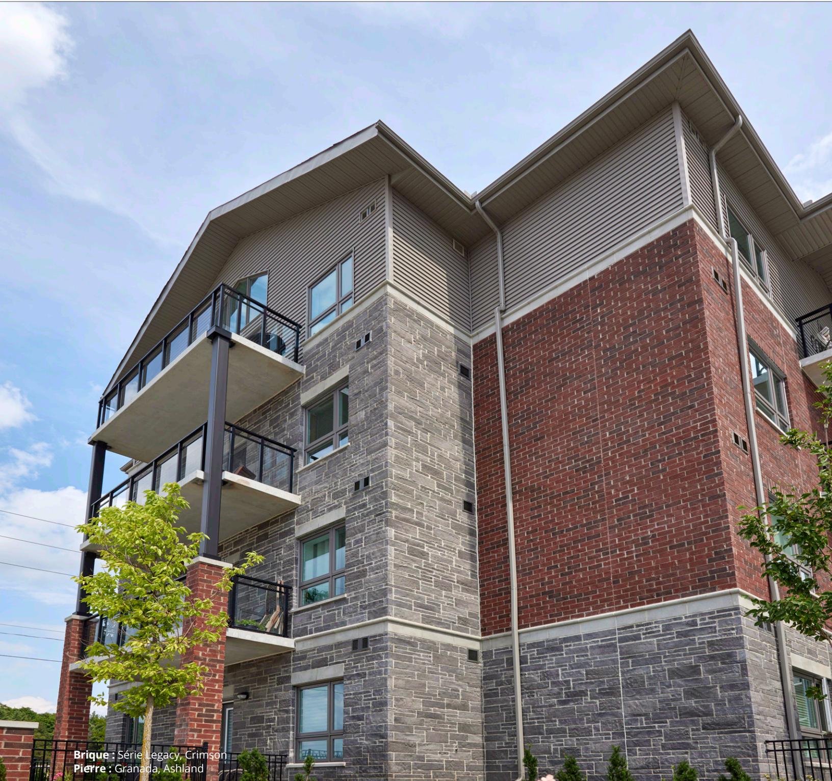
Brique : Série Legacy, Crimson Pierre : Granada, Ashland

Les compositions de couleurs fraîches et marbrées font de Granada une pierre adaptable aux tendances du design chic d'aujourd'hui. La collection Granada, proposée dans une gamme de couleurs séduisantes, offre des textures uniques qui se combinent facilement avec nos briques d'argile et de béton et particulièrement bien avec le style élégant et lisse de la Contempo pour créer des options de design uniques.