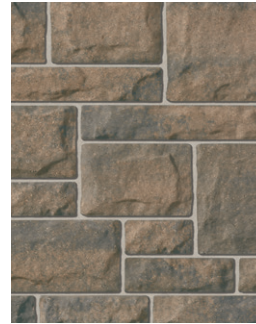
BRUME Emballage Multi