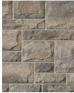
CHAMPAGNE Emballage Multi