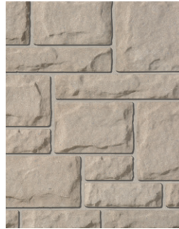
DOVER Emballage Multi