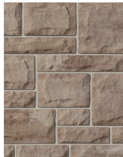
LITTORAL Emballage Multi