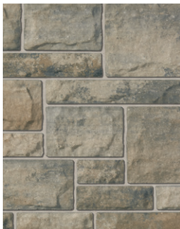
PICASSO Emballage Multi